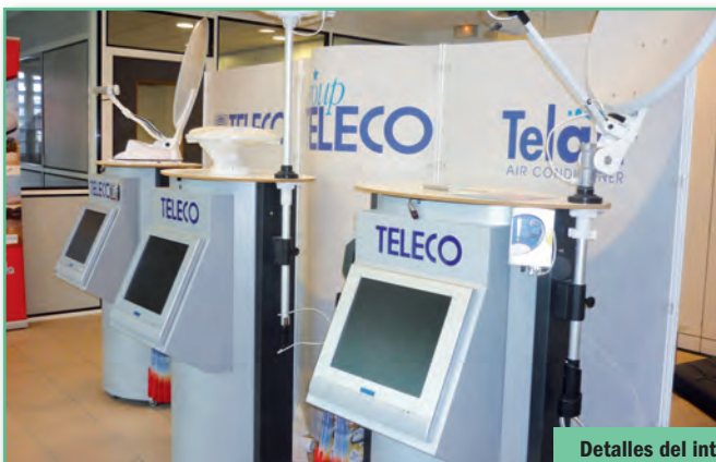
Detalles del interior de Teleco Francia.

En 1997, al observarse un crecimiento en el turismo al aire libre, la sede de Lugo de Ravenna decide diversificar su producción también hacia los aires acondicionados, y surge Telair, que empieza a