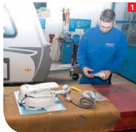
Überprüfung der Einbaukomponenten auf Vollständigkeit.

Vorhandene technische Voraussetzungen: 12 Volt Gel-Batterie und Fernsehgerät mit eingebautem SAT-Receiver. Der fachmännische Einbau erfolgte bei Pfaff-Camping in Ober Grafendorf.