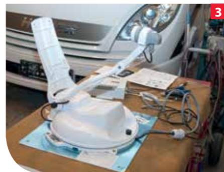
Nun werden die Geräte mit den mitgelieferten Kabeln verbunden und an eine externe Batterie angeschlossen. Über das Bedienpaneel wird die Funktion des Motors der Dreheinheit getestet.