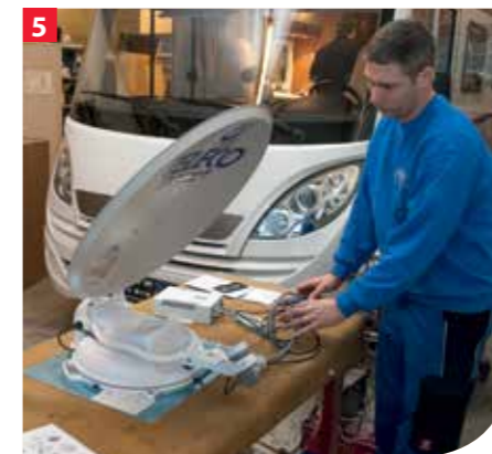
... und die Funktion getestet.