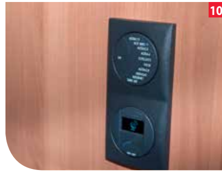
Die Steuereinheit wird im Kleiderschrank montiert und mit den Kabeln von der Dreheinheit und den zuvor montierten Bedienpaneel verbunden.