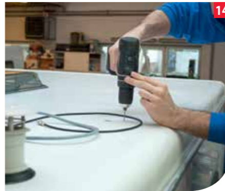
Die Befestigungslöcher für die Dachdurchführung wird gebohrt.