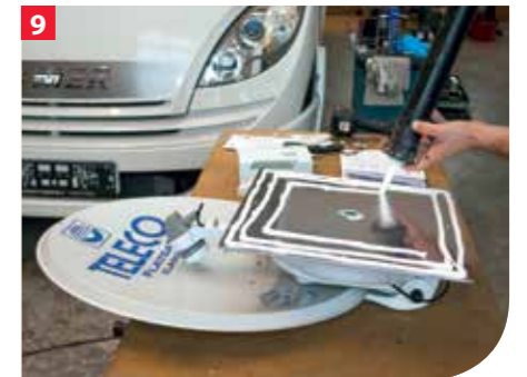
Nun wird sowohl auf der Befestigungsplatte der Dreheinheit als auch auf der Unterseite der Durchführungsbox Sikaflex zum Verkleben reichlich aufgebracht.