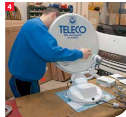
Die Parabolschüssel wird am Tragarm befestigt ...