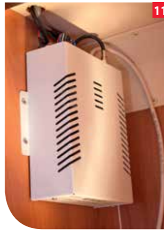
Das direkte Kabel zur Wohnraumbatterie muss einen Mindestquerschnitt von 2,5 Millimeter aufweisen.