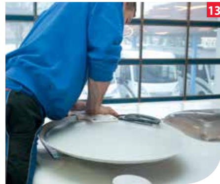
Die Dreheinheit wird durch Andrücken mit dem Dach verklebt.