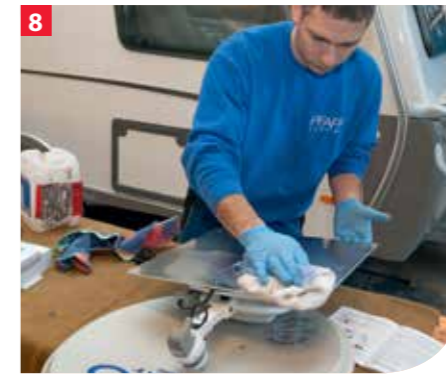
Die Klebeflächen auf der Montageplatte und am Dach werden gesäubert und entfettet.

WICHTIG! Der dabei entstehende Bohrstaub wird mit einem Fön weggeblasen um keine Kratzer durch wegwischen zu verursachen.