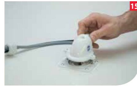
Die Dichtungsplatte wird mit Sikaflex und den Befestigungsschrauben auf dem Dach fixiert. Die Verbindung zwischen den Kabeln wird mit einem Schrumpfschlauch zusätzlich abgedichtet und die Kabel in einem am Dach verklebten Kabelkanal verlegt.