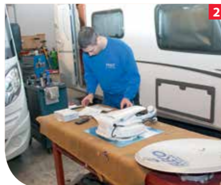
Sind alle Komponenten vollständig kann mit der Montage begonnen werden. Die Montageanleitung liefert die dafür notwendigen Hinweise.