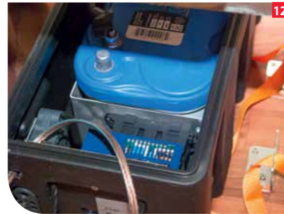
Die beim Reisemobil zusätzliche Sicherheitsschaltung zum Zündschloss kann zwar simuliert (D+ Simulator) werden ist aber nicht unbedingt nötig. Es darf halt vor dem Wegfahren auf das Einfahren der Schlüssel nicht vergessen werden.