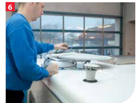
Am Wohnwagen wird der für die Montage und für den Kabeldurchlass vorgesehene Platz angezeichnet und das Loch für die Kabel gebohrt.